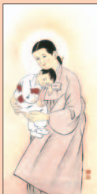
Une image coréenne

Les 16 fraternités de la province de Rio de Janeiro ont eu leur 4ème rencontre, du 10 au 15 octobre 2000, avec la participation de 80 membres des fraternités et 9 frères animateurs. La rencontre a commencé sous les auspices de "Nossa Senhora Aparecida", patronne du Brésil. Outre les exposés du frère Provincial et d'autres frères, la présentation des activités de chaque fraternité a été très enrichissante. L'échange des expériences a permis de se rendre compte des difficultés communes et de la diversité des projets, des plus simples aux plus audacieux.