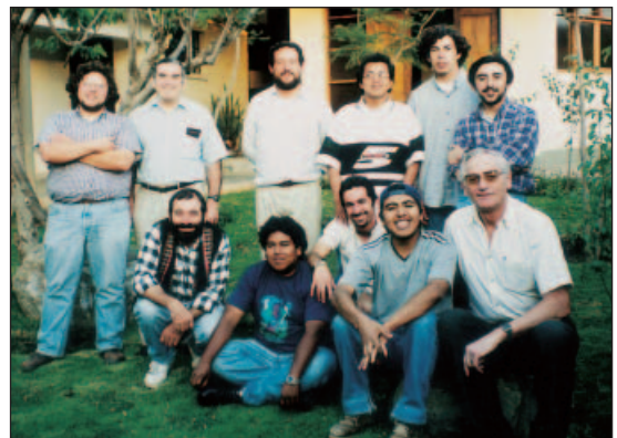
Avec les novices de Cochabamba, Bolivie

Un chemin de sainteté est d'autant plus sûr et enraciné que la source qui l'inspire est connue. Orienter sa vie à la manière de Marie, c'est essayer de vivre aujourd'hui les intentions et les intuitions de Saint Marcellin dans la réalité concrète, réalité qui est notre unique lieu théologique, c'est-à-dire notre unique chance de rencontrer Dieu dans notre réalité quotidienne. ♦