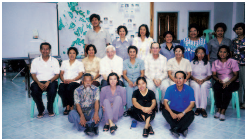
VIème Rencontre nationale des Fraternités de Mexique, le 3 au 5 novembre 2000

Les fraternités de la province de Santa Maria, Brésil, ont eu la chance de partager une après-midi entière avec le Frère Benito, Supérieur général, à l'occasion de sa visite aux provinces du sud du Brésil. Les membres des six