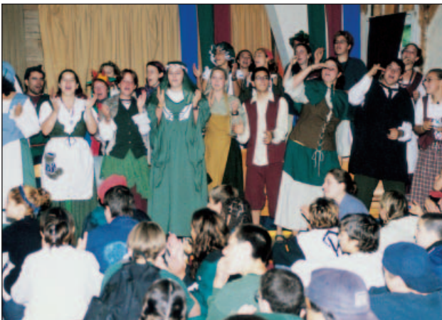
Des enfants et leurs moniteurs habillés pour la Messe

Mais ce qui n'a peut-être pas changé, c'est une approche pastorale qui a fait ses preuves : on fait toujours appel aux atouts que représentent l'équipe, la nature et le jeu. En somme, il s'agit d'une approche qui passe par l'expérience personnelle. Problème ? La pasto y a plutôt vu un défi de créativité, une occasion de laisser surgir une communauté chrétienne au visage nouveau, une famille dont les membres, jeunes et moins jeunes, cherchent ensemble les signes de la présence de Dieu au cœur de leur vie quotidienne. ♦