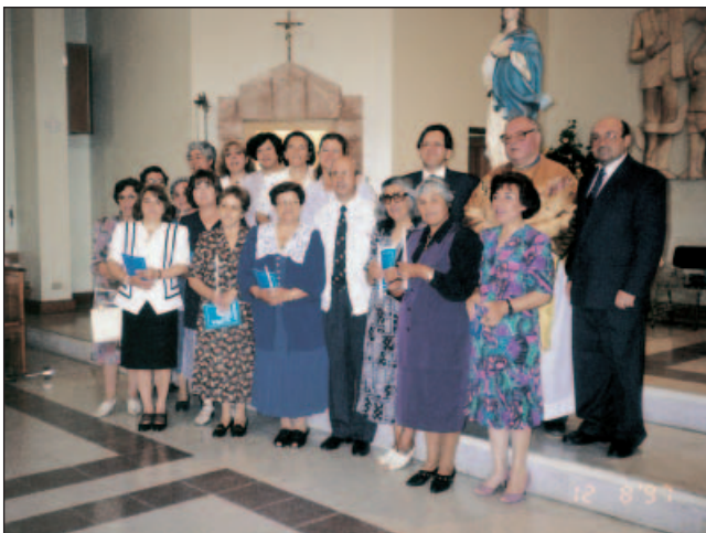
Fraternité "San Marcelino Champagnat" de Rancagua, Chile.

Les fraternités de Norte (Espagne) qui partagent souvent sur le Projet de Vie, nous font part de leurs sentiments sur l'art. 17 " La fraternité est un domaine privilégié où nous réalisons notre mission ".