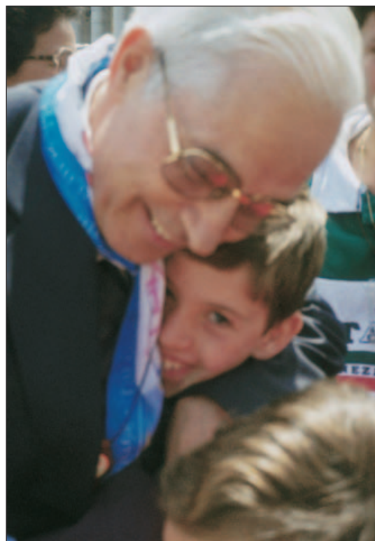
Etre mariste, c'est aimer les enfants et les jeunes.

referme sur nous-mêmes et crée la confusion entre ce qui paraît "indispensable" et ce qui est "essentiel". Penser et agir en Eglise, en tenant compte des urgences du monde et des jeunes, est un signe d'espérance. Cela nous permet d'envisager notre avenir en Dieu et d'approfondir nos raisons de rester frères ou laïcs maristes. ♦