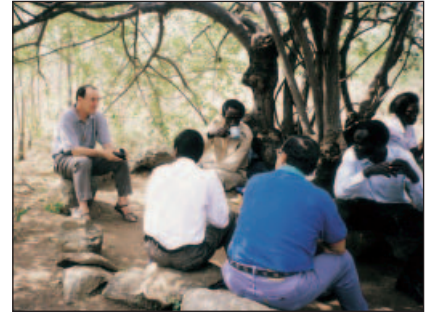
Avec les Frères de Masonga, Tanzanie.

J'en évoquerai deux : d'abord, le grand défi