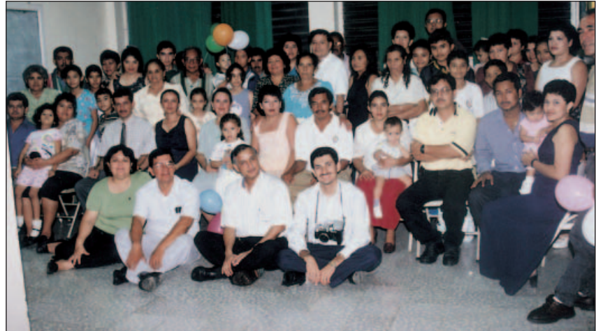
Fraternité San Miguel, El Salvador.

Sont nombreuses aussi les Fraternités qui ont vu le jour dans la