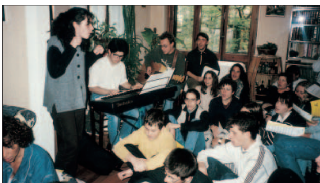
Réunion avec les jeunes

Je ne puis finir sans dire combien cette vie et mission communautaires ont rejailli sur ma vie professionnelle et enraciné la joie du travail ensemble. Chaque jour ma vie familiale et ma vie d'engagement gagnent en harmonie. ♦