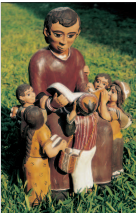
A la Maison provinciale de Lima, Pérou.

Les expériences scolaires pénibles et les relations difficiles qu'il a subies l'ont doté d'un patrimoine éducatif tel, qu'il enrichira son charisme pédagogique. A partir de sa mission et de son charisme, Marcellin approche les enfants et les jeunes, comprend leurs besoins, est sensible à leur misère, reste toujours prêt à porter remède en leur évitant les efforts excessifs et en transformant même les difficultés en succès. ♦