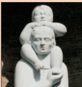
Détail de la statue

La fraternité " Mamá Muxima ", Angola, nous dit pourquoi elle a choisi ce nom pour la fraternité. C'est en relation avec un sanctuaire Marial très populaire en Angola, " Notre Dame de Muxima " dédié à l'Immaculée que le peuple appelle affectueusement " Mamá Muxima " ce qui signifie cœur, tendresse. Beaucoup de gens fréquentent ce sanctuaire avec une grande confiance en Marie, comme saint Marcellin ; la fraternité l'a choisie pour Patronne. Ses membres sont presque tous professeurs et infirmiers. Outre leur activité professionnelle, ils assurent la catéchèse et la pastorale des jeunes dans un quartier de la ville, Ndalatando.