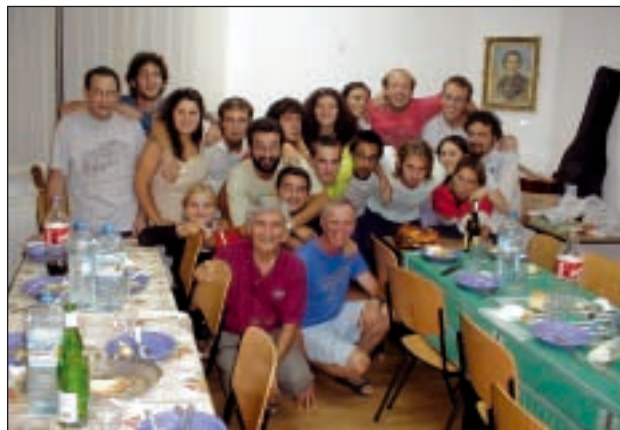
Un groupe de volontaires, joyeux dans leur travail

nous concerne individuellement, qui touche notre groupe et la ville de Bucarest. Parmi les volontaires, nombreux étaient ceux qui rencontraient pour la première fois les Frères et l'esprit mariste incarné dans une réalité concrète. Cela nous a permis de faire communauté dans le respect et la richesse des différences et ce fut là le moteur de notre expérience.