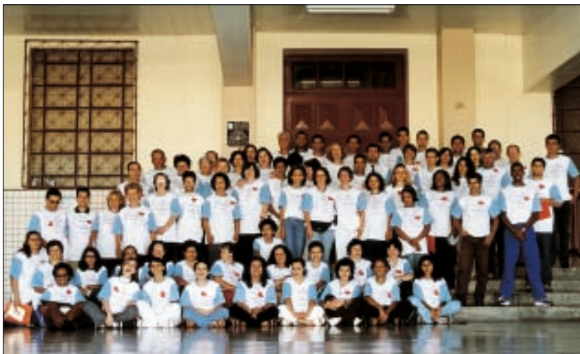
Ve Rencontre des Fraternités, Province de Rio de Janeiro, Brésil