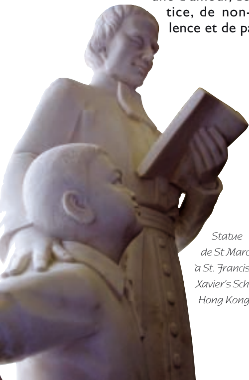
Statue de St Marcellin à St. Francis Xavier's School, Hong Kong