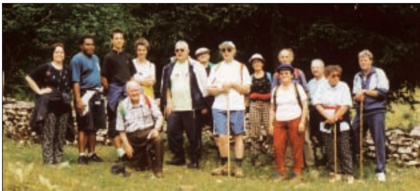
Les membres de Fraternités partagent leurs vacances