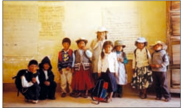
Les enfants nous permettent d'apprendre beaucoup

Nous avons participé ensemble aux célébrations du village, aux funérailles, à la bénédiction des aliments au carnaval, et aussi à l'Eucharistie. Tous ces moments pour partager sur un pied d'égalité et pour apprendre les uns des autres à découvrir de nouvelles sensibilités devant la vie et