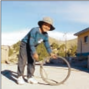
Un enfant qui joue à Tiquina

Sur invitation spéciale, Gesta, Fondation Mariste pour la solidarité, a préparé et envoyé deux jeunes chiliennes pour une expérience de volontariat auprès de “présence mariste” de Tiquina (Bolivie).