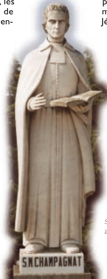
Sculpture de saint Marcellin à Fátima, au Portugal.

Le meilleur signe du véritable amour du Fondateur pour Marie, nous le trouvons justement dans cette caractéristique, celle de la présenter habituellement en référence à Jésus avec des expressions qui nous sont devenues familières. La plus typique, sans doute, est celle que nous trouvons dans la conclusion de ses lettres : « Je vous laisse dans les Sacrés Cœurs de Jésus et de Marie » ♦