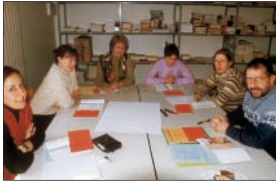
Formation mariste à l'Hermitage

du Venezuela, on nous a dit à nous laïcs que nous sommes de la Famille Mariste et je me demande aujourd'hui : quelle portée a pour le laïc le fait d'être de la Famille Mariste ? Jusqu'où pouvons-nous aller ? Jusqu'où voulons-nous aller ? Jusqu'où nous permet-on d'aller ?