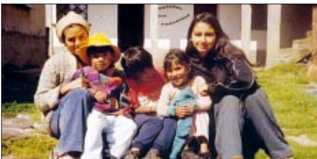
L'éducation est un travail de proximité et d'amour

Cela n'a duré qu'un mois, mais nous avons senti ce nouveau langage de l'amour qui aide à vivre. Que cette « mission partagée » ne s'arrête pas, que nombreux soient les jeunes et les laïcs pour travailler avec les frères à diffuser le message de Jésus à la manière de Marie. Que nous sachions avec courage et par amour avoir l'audace de vivre nos rêves et de les partager. ♦