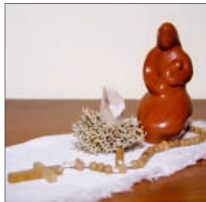
Le rosaire, prière du cœur

Pensez à tous ces rosaires que vous auriez pu abandonner avec un peu trop de précipitation et reprenez, une fois de plus, la pratique de cette prière du cœur quand vous célébrez les mystères de votre foi. ♦