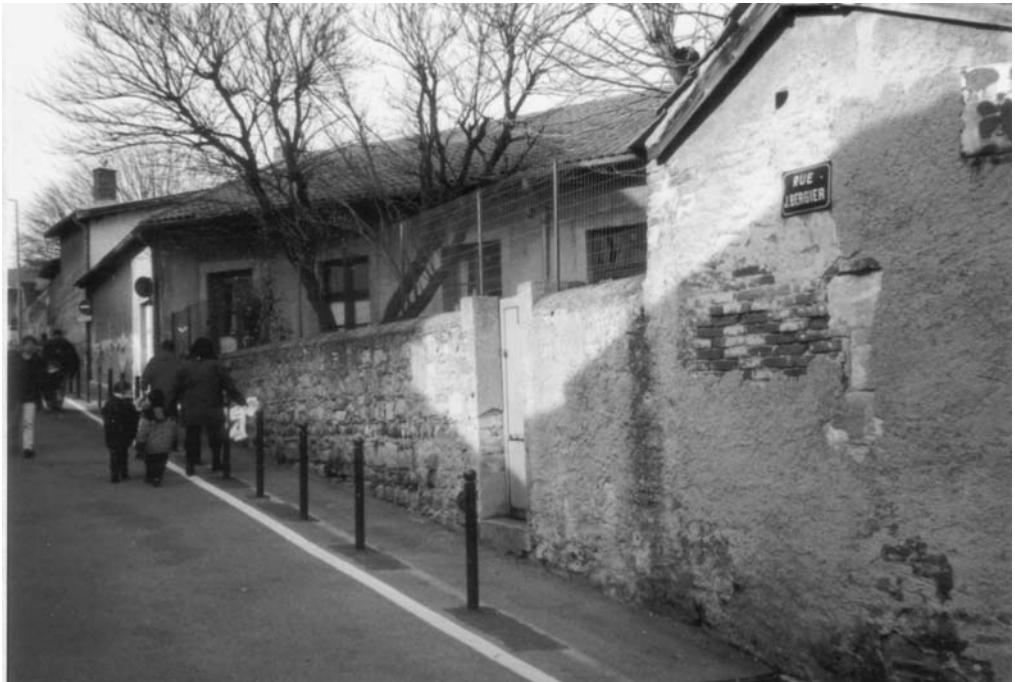
Fig. 6 – Première école des Frères à St Genis Laval, en 1853.