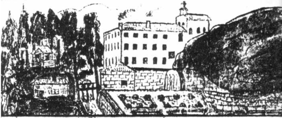
Fig. 5 – Première représentation de l'Hermitage Dessin du Père Bourdin, Mariste, en 1829.