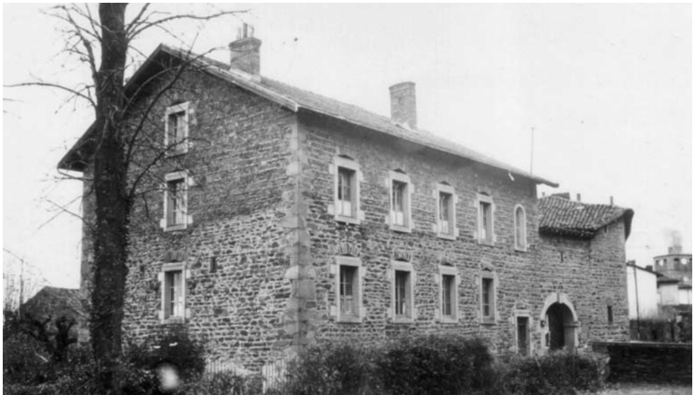
Fig. 8 – Ecole de Larajasse, près de St Symphorien le Château.