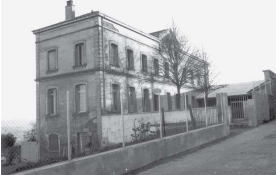
Fig. 7 – Ecole paroissiale de St Martin la Plaine.