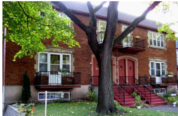
Résidence de la communauté d'accueil à Montréal

Il est accessible aux jeunes, filles et garçons, de 18 à 35 ans «ouverts à la dimension religieuse», mais ayant parfois très peu de références chrétiennes. Ceux-ci peuvent y vivre une année complète ou une session universitaire de quatre mois seulement. Cet engagement peut se prolonger sur deux ou trois ans.