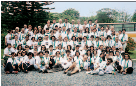
3º encuentro de fraternidades. Rio de Janeiro, Brasil.

Es una propuesta a los seglares que quieren compartir con nosotros la espiritualidad y la misión de Champagnat. Se organizan en grupos muy flexibles llamados "fraternidades maristas". Se les propone un proyecto de vida que afecta a su vida cristiana, familiar y profesional.