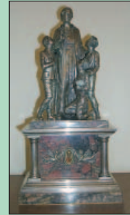
Relicario de la Beatificación entregado al Papa Pío XII por los hermanos maristas en 1955.