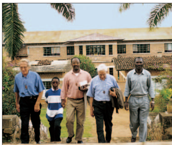
Visita del H. Benito a Nyangezi. República Democrática del Congo.

Vivimos todo esto con esperanza y con gozo. Entre todos vamos convirtiéndolo en realidad visible que se manifiesta de muchas maneras y que la formulamos con expresiones como éstas: misión compartida, vida en Fraternidad del Movimiento Champagnat, voluntariado, "tú y yo