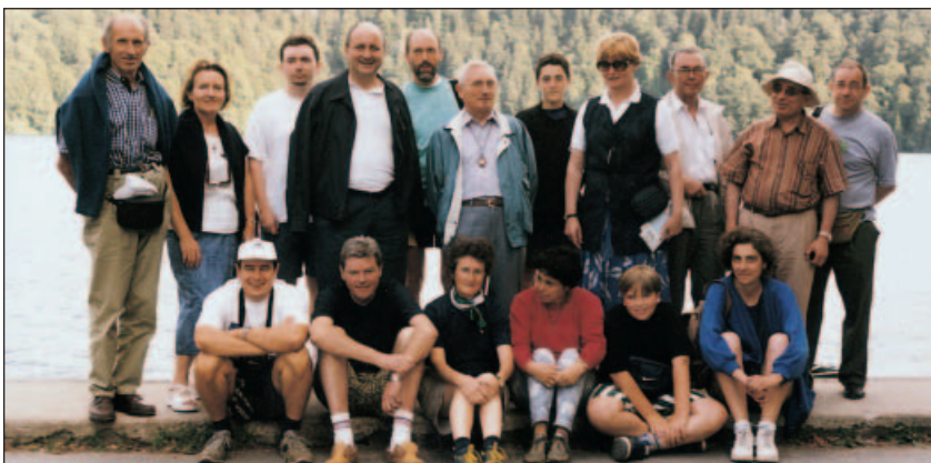
Miembros de varias fraternidades de Francia en Touves.

No termino sin antes decir que mi voz es la de muchos antiguos alumnos maristas, y que desde Cuba me hago portador para pedir por los hermanos maristas y estos grupos, que Dios siga bendiciendo su obra, que, de por sí, es un granito de arena en la “construcción de la civilización del amor” a la que estamos llamados todos por medio de Juan Pablo II”. ♦