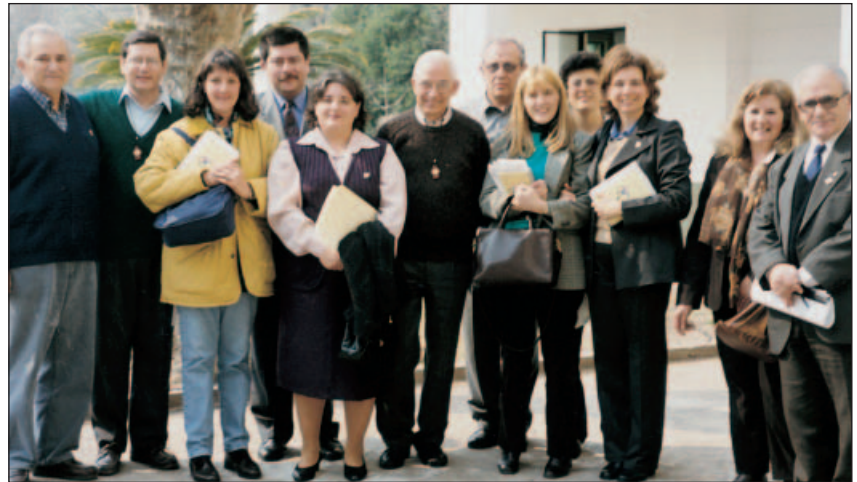
Nueva fraternidad “San Marcelino” del Colegio San José de Morón. Argentina.

ís están adoptando la costumbre de reunirse una vez al año para compartir experiencias, oración, inquietudes y proyectos. La visita del H. Superior general o de algunos Consejeros generales constituyen un motivo para celebrar esta reunión como ha ocurrido en México, América Central, Brasil, Argentina y Colombia. Los participantes suelen expresar su entusiasmo y su decisión por continuar viviendo su fe cristiana al estilo de María y Champagnat, y por emprender acciones que extiendan esta espiritualidad en sus respectivas ciudades.