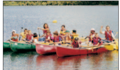
En el lago Morgan

Pero lo que quizás no haya cambiado es un acercamiento pastoral que ha hecho sus pruebas: siempre se apela al "triumfo" que representa el equipo, la naturaleza y el juego. Resumiendo, es una nueva búsqueda que pasa por la experiencia personal. ¿Problemas? La pastoral ha visto más bien un reto a su creatividad, una ocasión de dejar que surja una nueva comunidad cristiana con una cara nueva, una familia donde los miembros, los jóvenes como los menos jóvenes, busquen juntos los signos de la presencia de Dios en el corazón de su vida diaria. ♦