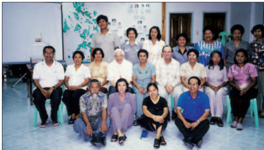
VI Reunión Nacional de las Fraternidades de México, 3-5 noviembre 2000