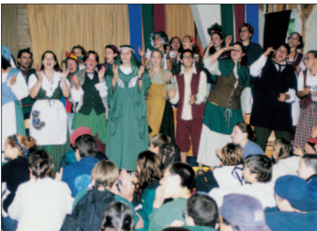
Monitores y niños vestidos para la misa

Hablar de la pastoral en los comienzos del campamento, es hablar de todo el campamento, de su razón de ser y del corazón de todos sus monitores y de su entrega. En el principio, solamente la presencia de los hermanos y la misa cotidiana eran suficiente, dado el clima religioso de la época, para que los jóvenes se des-