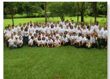
École Vocationnelle Mariste Brasil Centro-Norte

mariste de Badalona. Il a étudié la pharmacie, les sciences religieuses et la psychologie, puis il a été nommé Vicaire provincial, service qu'il a commencé en 2010 et qui s'achèvera en août 2016.