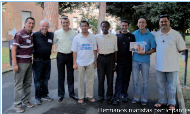
Hermanos maristas participantes

* Elaborar materiales que puedan ayudar a continuar la oración y la reflexión sobre el tema.