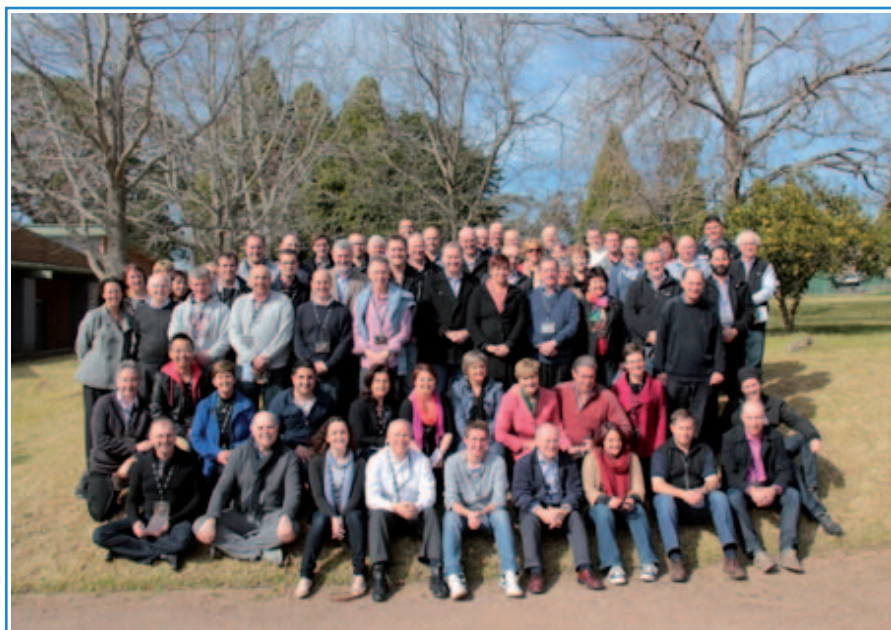
Provincial y su Consejo de Misión; un consejo que comprende hermanos y laicos maristas.

* La Ratificación de la Carta del Consejo de la Misión. Esto fue un importante resultado para la Provincia. Con esto las decisiones que se refieren a la misión pasan del Consejo Provincial al