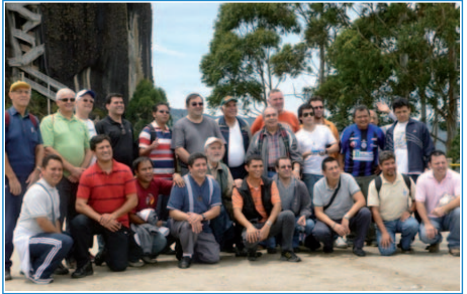
Frères de la Sous-commission.

Le troisième jour, journée de repos, nous avons pu partager fraternellement avec la communauté du noviciat inter-provincial de Guatapé. Nous avons fait un beau tour dans les parages de la Piedra El Peñol et du village de Guatapé. Le temps s'est montré splendide et nous a offert une magnifique journée ensoleillée.