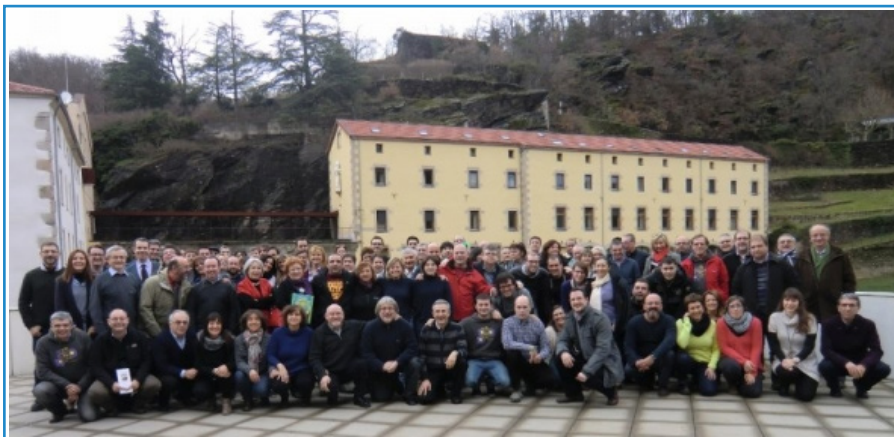
Finalmente, uma visita guiada pelos irmãos da comunidade aos locais renovados de La Valla.