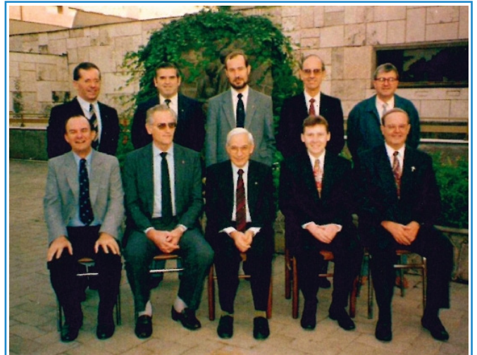
Consejo General - 1993

A dos kilómetros de su destino, el jeep de los franceses cayó en una cuneta y el convoy se detuvo para devolver el jeep en la carretera. Los dos hermanos, sin saber lo que pa-