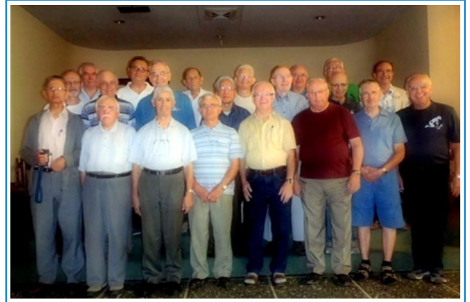
8. Vers les 200 ans d'existence de l'Institut des Frères Maristes, en 2017.