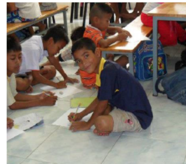
Droit de l'enfant à la participation