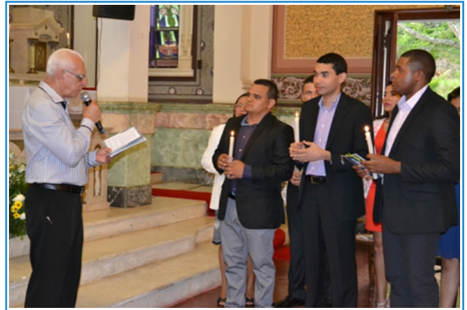
Escuela Marista Champagnat de Teresina y estudia pedagogía.