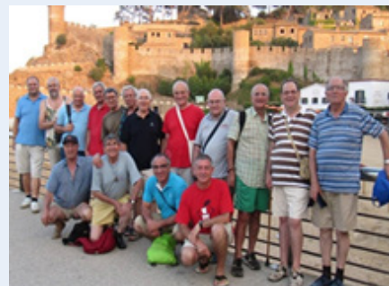
Hermanos de la Provincia Compostela