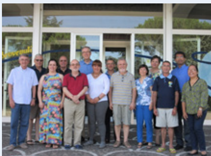
Réunion de la Commission du MChFM