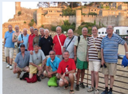
Frères de la Province Compostela