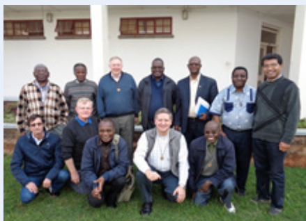
Nairóbi: MIC-MIUC Reunião orçamento