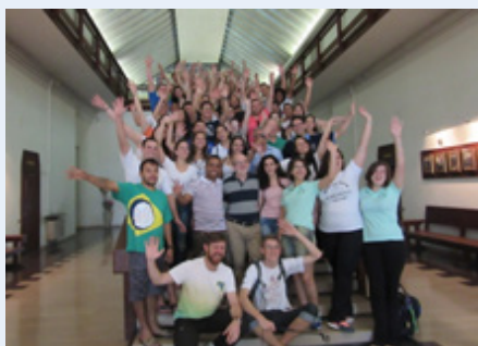
Brasil Centro-Sul na Casa Geral