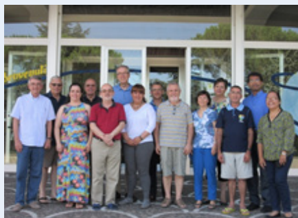
Roma: Comissão Internacional do MChFM