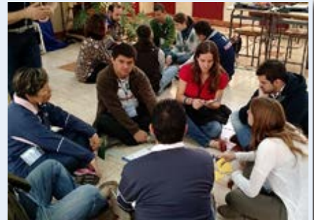
Perú: Encuentro Continental Marista de Coordinadores de la Evangelización