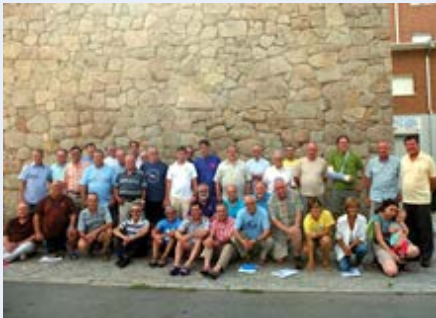
El Escorial Réseau des Communautés de la l'Europe