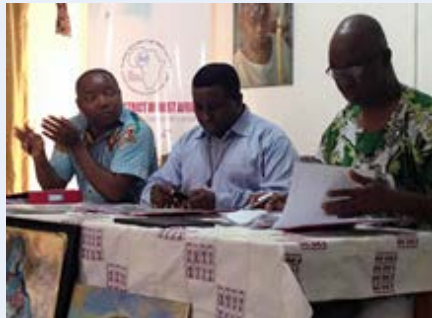
Gana Capítulo do Distrito da África del Oeste