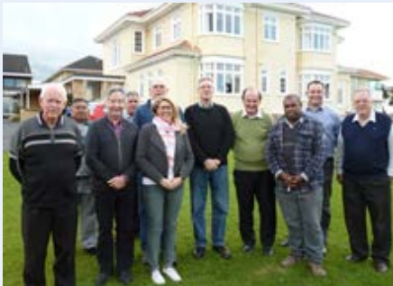
Nova Zelândia Conselho Regional da Oceania