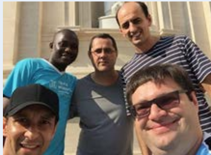
Vaticano Irmãos do Curso Gier