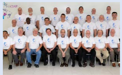
Brasil: III CIAP, en Curitiba