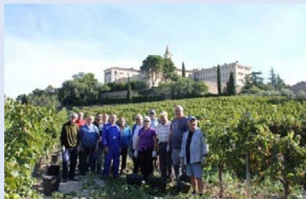
España: Finalizó la vendimia en el Monasterio de Les Avellanes el 22 de septiembre