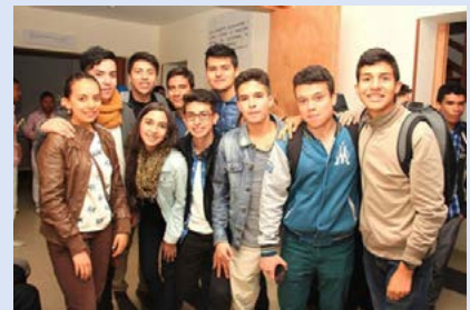
Colombia: inauguración de la Casa de la Juventud Marista CAJUMA en Bogotá