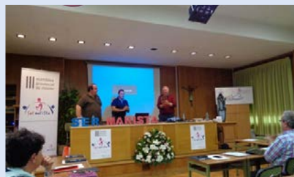
España: Compostela - III Asamblea Provincial de Misión, en Valladolid