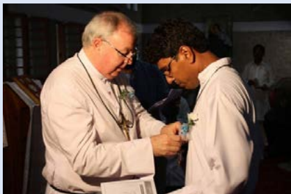
Pakistán: Profesión perpetua del H. Farancis King