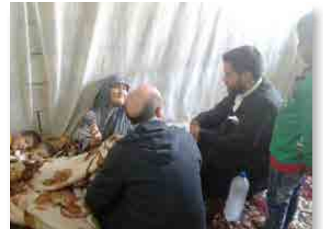
Líbano: Los hermanos del Proyecto Frattelli en un centro de refugiados en Sidón