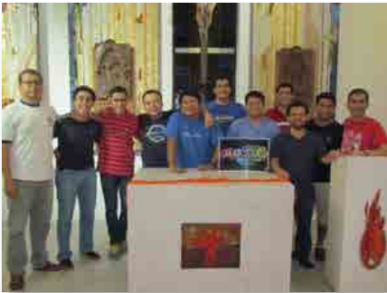
El Salvador: Encuentro de pastoral vocacional marista