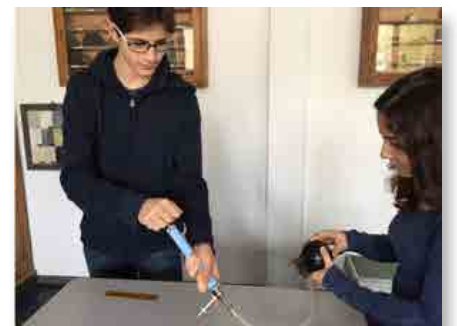
Italia: Istituto San Leone Magno, en Roma