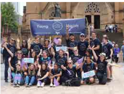
Austrália: Pastoral Juvenil Marista de Brisbane