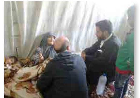
Líbano: Os irmãos de projeto Fratelli em um albergue de refugiados em Sidon