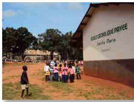
República Centro-Africana: Escola Primária de Berberati