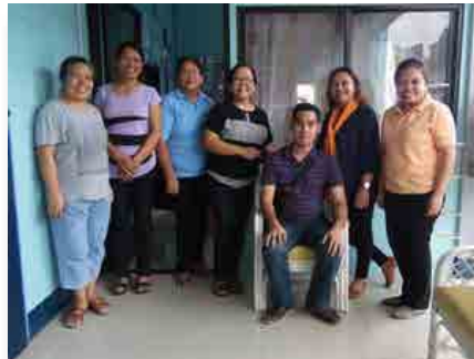
Filipinas: Encontro do grupo de coordenação do MChFM, em Cotabato