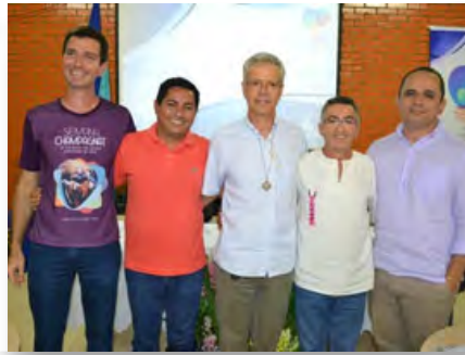
Brésil: Nouveau Conseil provincial de Brasil Centro-Norte