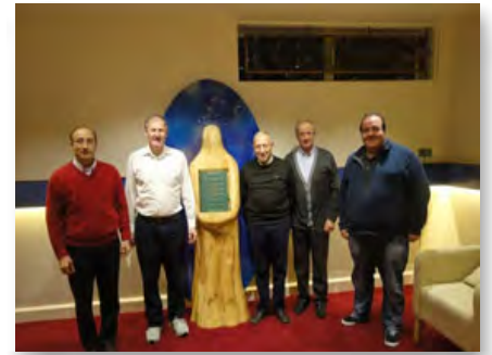
Irlande: Réunion informelle des provinciales d'Europe à Dublin