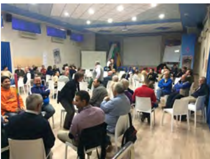
Espagne: Assemblée de la Province Méditerranéenne, Guardamar