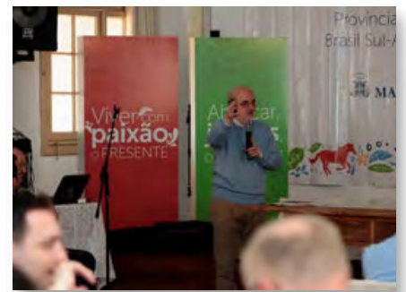
Brésil: Chapitre de la Province Brasil Sul-Amazônia