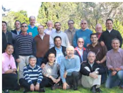
Italie (Maison Générale): Communauté de l'Administration Générale