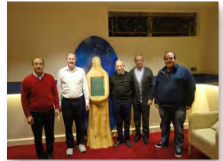
Irlanda: Encontro informal dos 5 provinciais da Europa em Dublin