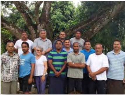
Sri Lanka: Programa para líderes do Distrito do Pacífico