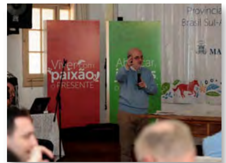
Brasil: Capítulo da nova Província Brasil Sul-Amazônia