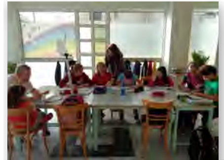
Grécia: Acharnès, centro social Coração sem fronteiras