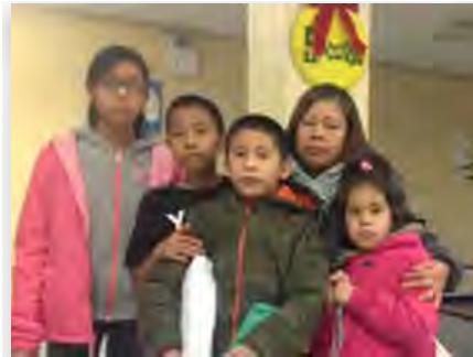
USA (Nova Iorque): Comunidade Juan Diego, Celebração de Natal