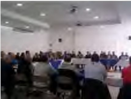
México: Capítulo da Província do México Ocidental