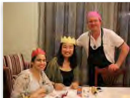
Austrália (Sydney): Pastoral Juvenil Marista