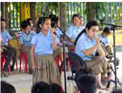
Camboja: LaValla School