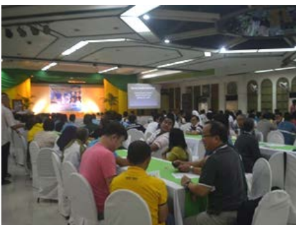
Filipinas: Encuentro de la familia marista en General Santos