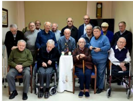
España: Hermanos de las Avellanes con la imagen de la virgen de Fourvière