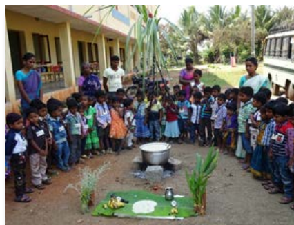
Índia: Trichy - Marist Nursery & Primary School