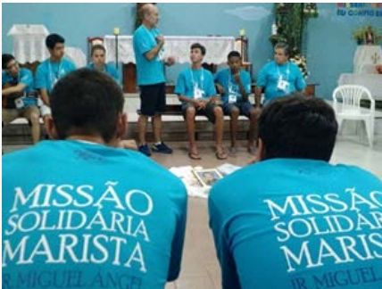
Brasil Centro-Sul Missão solidária Marista em Caçador