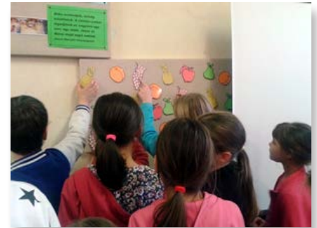
Hungria: Győri Marista Laikus Csoport