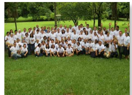
Escola Vocacional Marista Brasil Centro-Norte

trabalho na Escola Marista de Badalona. Fez a profissão perpétua em 1994. Depois fez um curso de formação para formadores de 1996 a 1998 em