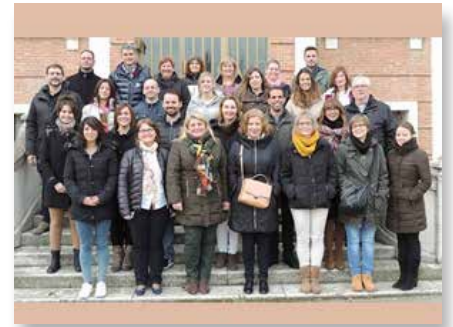
Valladolid : cours pour les enseignants des quatre provinces de l'Espagne