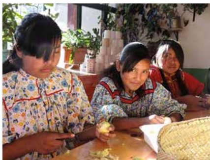
Mission Mariste dans la région de Tlahumara, Mexique