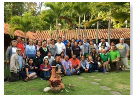
Rencontre des laïcs maristes à Los Teques - Venezuela

particulière d'être et de construire l'Église.