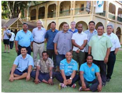
Frères du District du Pacifique à Brisbane, Australie