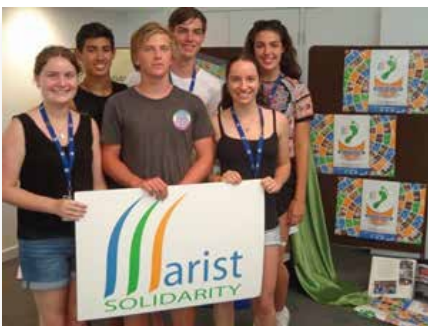
Rencontre des leaders des élèves maristes à Brisbane, Australie