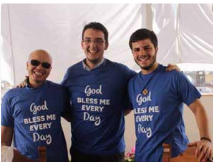
Espagne - Novices d'Europe Sevilla