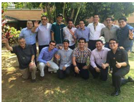
Colombie Noviciat La Valla de Medellín