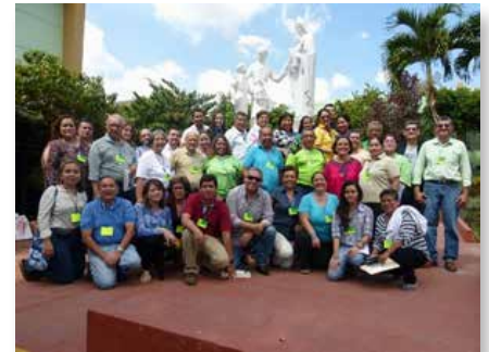
El Salvador Retiro das fraternidades do MChFM