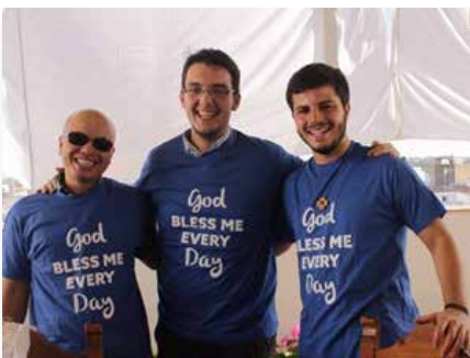
Espanha: Noviços da Europa Noviciado de Sevilla