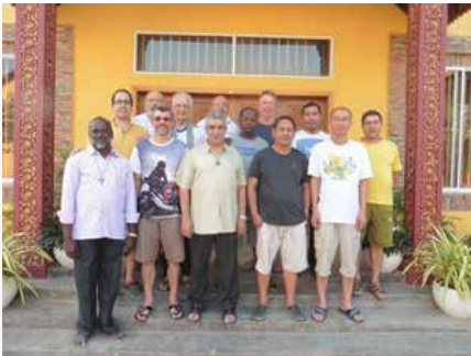
Camboja - Encontro do Distrito da Ásia em Phnom Penh