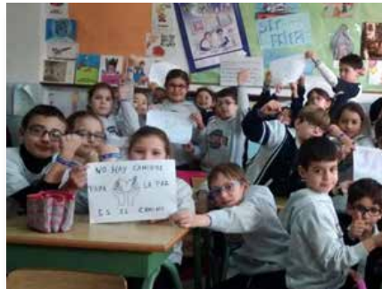
Espanha: Colégio Marista 'San Fernando' em Sevilla