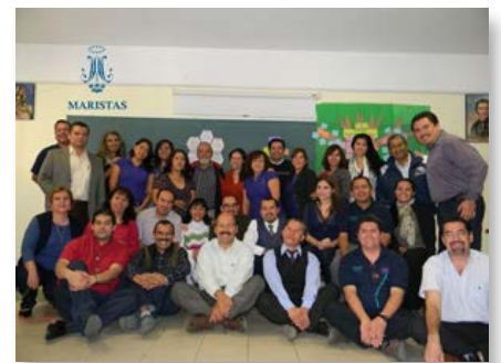
México: Comunidad Educativa Marista del Instituto Morelos en Uruapan