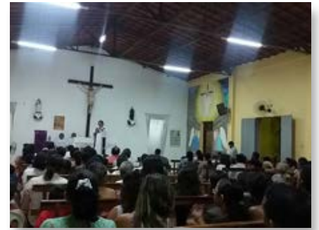
Brasil: Comunidad São Marcelino Champagnat - Iguatu