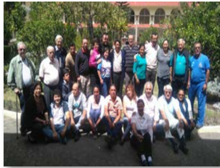
Ecuador: Encuentro de Equipos Nacionales de Pastoral Marista