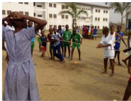
Camerún: Notre Dame des Nations Yassa