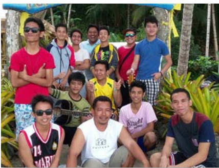
Filipinas: Postulantes en General Santos