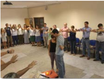
Uruguay: Celebración de envío misionero para la Comunidad "La Vida" de Tacuarembó