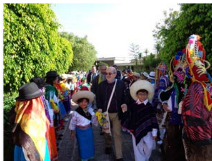
Equador: Conselho Geral Ampliado para a Região Arco Norte