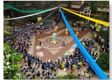
Brasil: Semana Pastoral Marista 2016, Brasil Centro-Norte