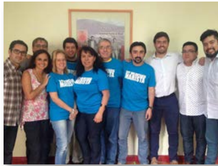
Chile: Encontro da Sub-comissão Inter-americana de solidariedade