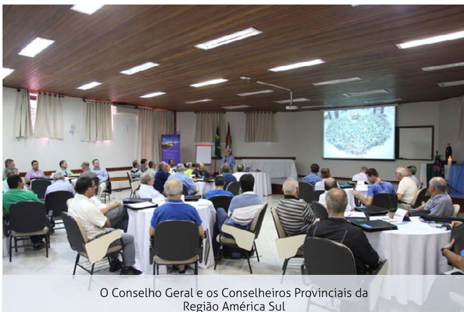
O Conselho Geral e os Conselheiros Provinciais da Região América Sul

No primeiro dia do mês de março, com o tema: "Ser ponte, rumo a um novo começo", teve início a Reunião do Conselho Geral Ampliado para a Região do Brasil e Cone Sul, no Recanto Champagnat, em Florianópolis, Brasil.