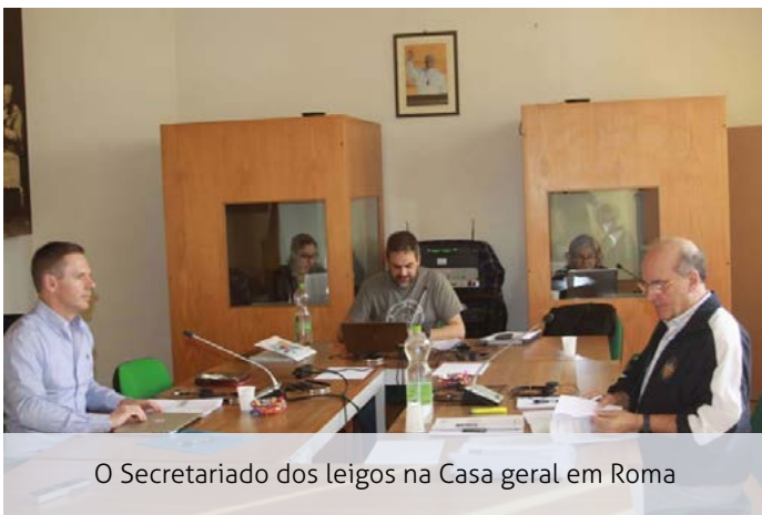
O Secretariado dos leigos na Casa geral em Roma