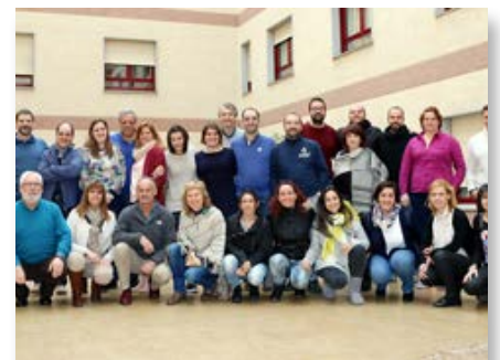
Espanha: Curso na Conferencia Marista Espanhola sobre solidariedade