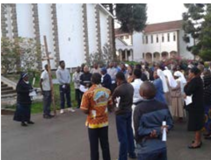
Quênia: Via sacra no MIC (Marist International Centre), Nairobi