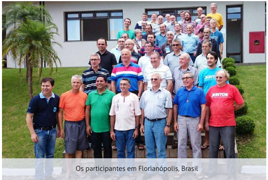
Os participantes em Florianópolis, Brasil

A Província informou que a iniciativa anual Missão Marista de Solidariedade, nos últimos três anos, realizou 83 experiências em diferentes cidades do país, com o envolvimento de 36 unidades educacionais e cerca de 4.600 missionários.