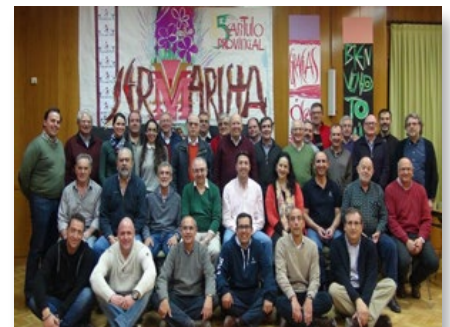
España: Capítulo de la Provincia Compostela