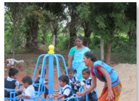
India: Marist Nursery School in Trichy