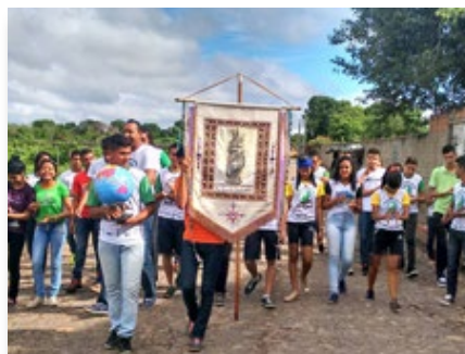
Brasil: Alumnos del Colegio Champagnat de Teresina