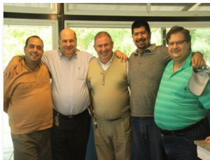
Argentina: Integración con Paraguay, Provincia Cruz del Sur