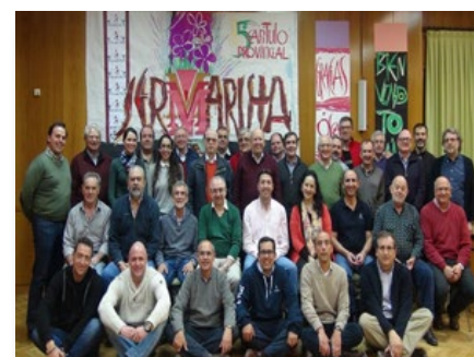
Espagne: Chapitre de la Province Compostela