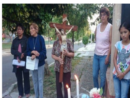
Bolivie: Postulants organisent le Chemin de Croix à Cochabamba