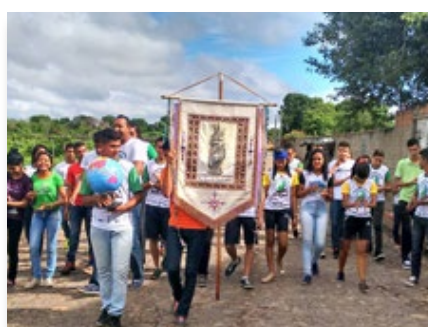
Brésil: École mariste à Teresina