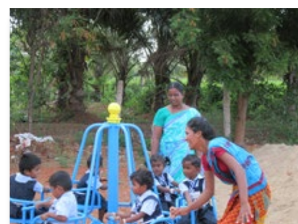
Inde: mariste Jardin d'enfants à Trichy