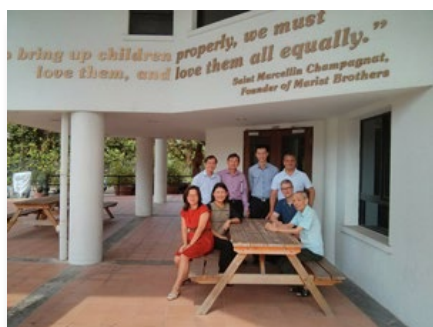
Singapur: Misión Marista