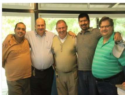
Argentine: Province Cruz del Sur