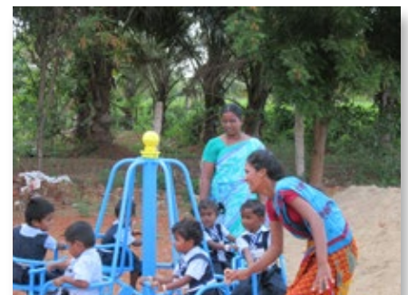
Índia: escola primária marista em Trichy