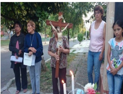
Bolívia: Postulantes de Cochabamba animam a via-sacra