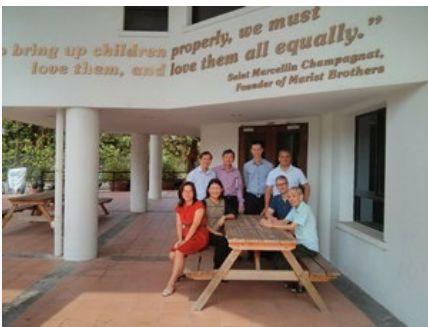
Singapura: Missão marista