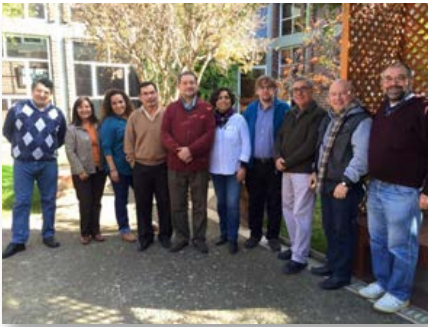
Chile: II Reunión de Coordinadores de Comisiones y Secretariado de Misión