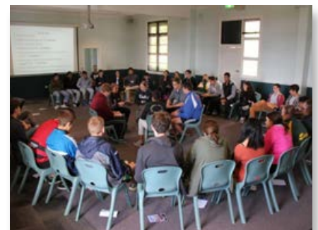
Australia: Estudiantes se reúnen con la pastoral marista de vocaciones

de estos talleres realizado en la provincia de África Austral, se ofreció a los países participantes la oportunidad de compartir buenas prácticas y centrarse en el rol del líder en un nuevo contexto africano”.