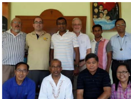
Tailandia: Conferencia Marista de Asia en Bangkok