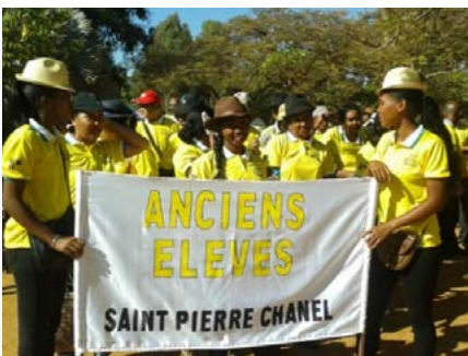
Madagascar: 30 Aniversario de la Escuela secundaria San Pedro Chanel