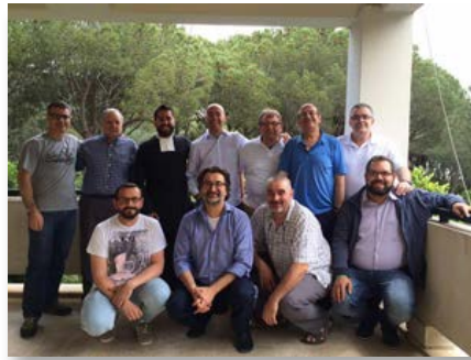
Líbano: Proyecto Fratelli en Rmeileh