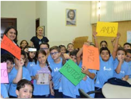
Brasil: Colégio Marista Palmas