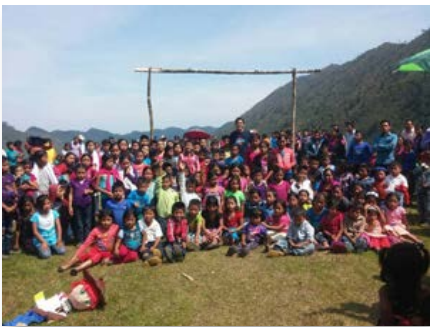
México: Com as crianças indígenas da Zona Alta da Missão de Guadalupe