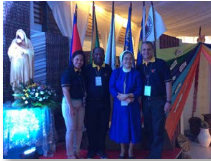
Filipinas: Missão Marista na Província East Asia — Koronadal