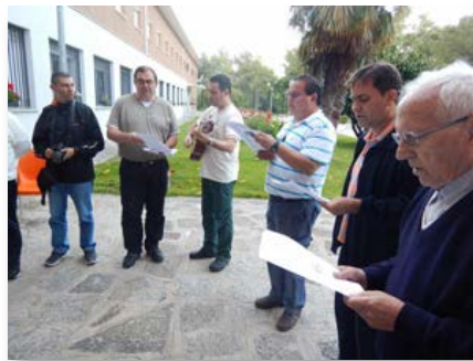
Espanha: Programa « Horizontes » em El Escorial