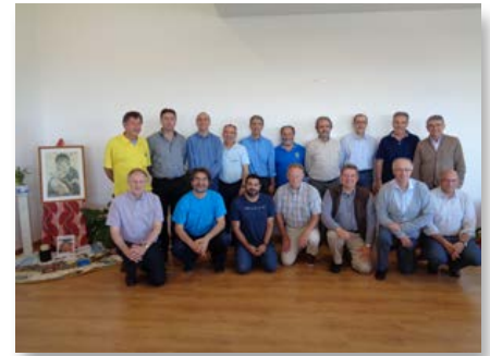
Portugal: Reunião da Conferência Europeia Marista, em Lisboa