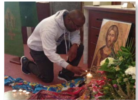
Itália: Programa "Horizontes" em Manziana