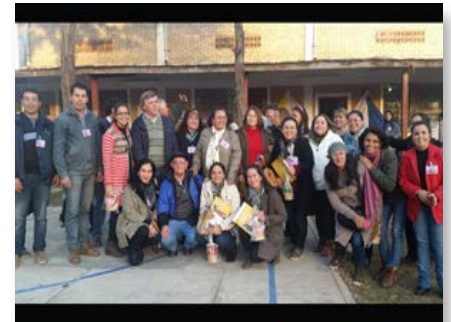
Paraguay: Asamblea de Misión