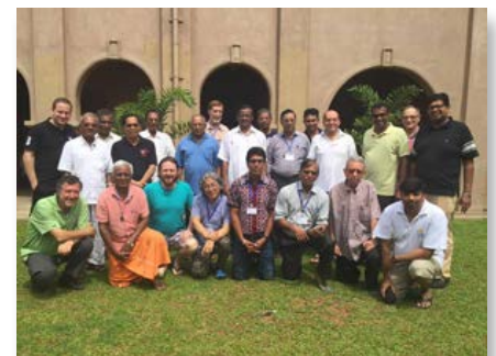
Sri Lanka: Seminario sobre la sustentabilidad para la Provincia de Asia del Sur

Los estudiantes procedían de Archbishop Molloy, Central Catholic, Christopher Columbus High School, Marist High School Bayonne, Marist HS Chicago, Msgr. Pace HS, Mt. St. Michael Academy, Roselle Catholic HS, St. Joseph Academy, Saint Joseph Regional HS, St. Mary's HS, del grupo de jóvenes de barrio East Harlem, y de las escuelas de Cana-