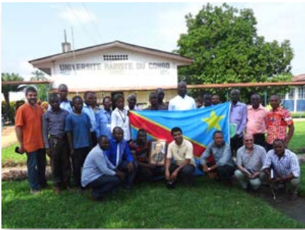
Kisangani: Universidad marista de Congo