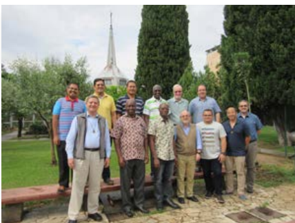
Casa Geral: Comissão Internacional Irmãos Hoje