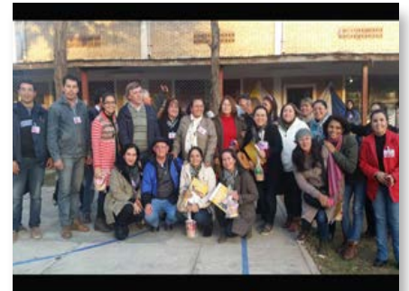
Paraguai: Assembleia de missão