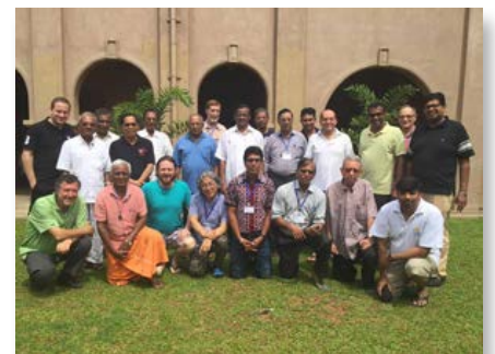
Sri Lanka: Seminário sobre a sustentabilidade para a Província Ásia do Sul

Os estudantes vinham de Archbishop Molloy, Central Catholic, Christopher Columbus HS, Marist HS Bayonne, Marist HS Chicago, Msgr. Pace HS, Mt. St. Michael Academy, Roselle Catholic HS, St. Joseph Academy, St. Joseph Regional HS, St. Mary's HS, do grupo de jovens do bairro East Harlem e das escolas do Canadá e México.