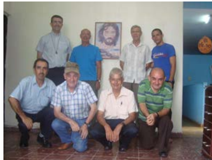
Cuba: Encontro de Irmãos