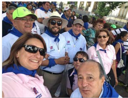
Mexique: Pèlerinage au Sanctuaire de El Tepeyac