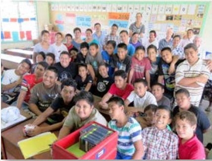
Samoa: École primaire des Frères Maristes à Mulivai