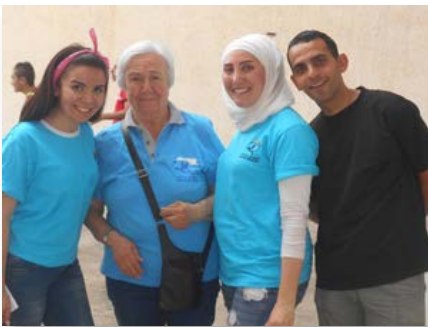
Syrie: Lancement des activités d'été - Skill School