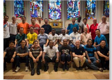
France: Les groupes du programme Horizons, ensemble à l'Hermitage