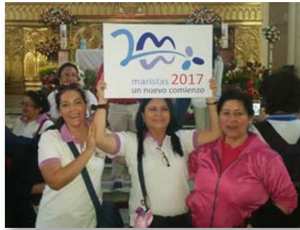
Équateur: Sanctuaire de Notre-Dame de Cisne