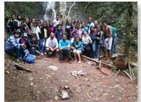
Bolivie: Volontaires maristes d'Espagne - SED à Roboré