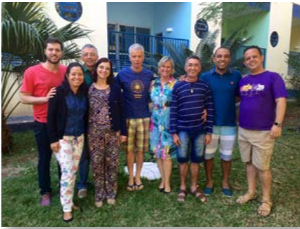
Brésil: Équipe de coordination Mouvement Champagnat à Taguatinga