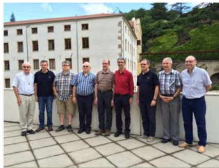
Nouveau conseil de la Province de L'Hermitage