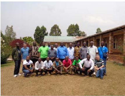
Rwanda: Deuxième session du Chapitre provincial de PACE à Save