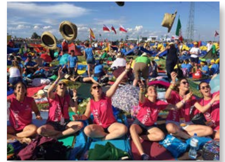
Espagne: Jeunes de Ibérica à Cracovie - JMJ