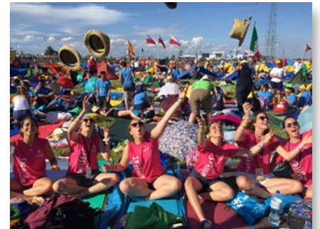
Espanha: Jovens da Província Ibérica em Cracóvia, na JMJ