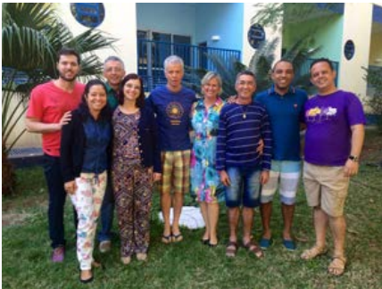
Brasil: Equipe de Coordenação do Movimento Champagnat, em Taguatinga