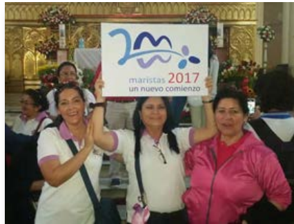
Equador: Santuário de Nossa Senhora de Cisne