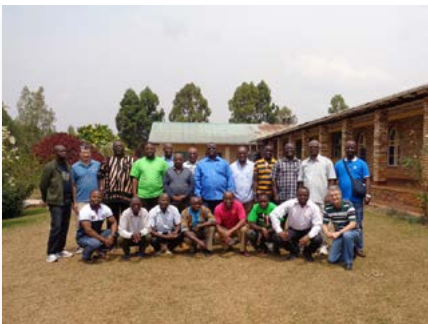
Ruanda: Save, segunda sessão do Capítulo Provincial, África Centro-Leste