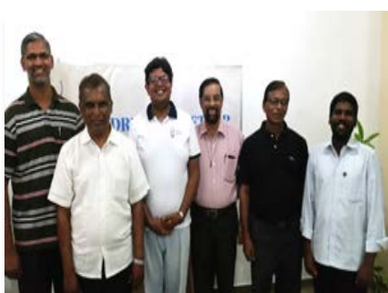
Sri Lanka: Nouveau conseil provincial de South Asia