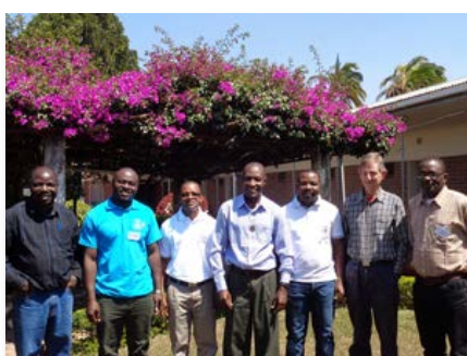
Malawi: Conseil d'Afrique Australe