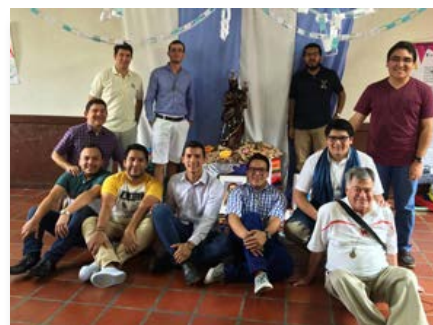
Colombie: Novicat La Valla, Medellín