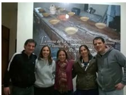
Argentine: Rencontre des Équipes pastorales à Luján