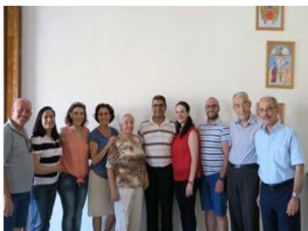
Syrie: L'équipe des Maristes Bleus