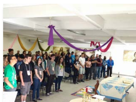
Brésil: Quatrième Assemblée de la jeunesse de la Province du Brasil Centro-Sul