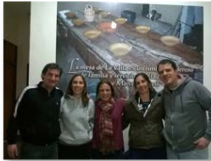
Argentina: Encontro de Equipes de Pastoral, em Luján