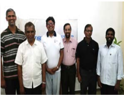
Sri Lanka: Novo Conselho Provincial de South Asia