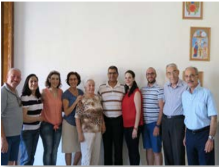
Síria: A equipe dos Maristas azuis em Alepo