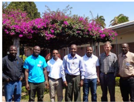
Malawi: Novo Conselho da África Austral