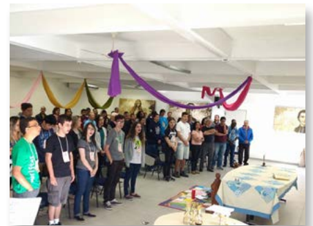
Brasil: IV Assembleia das Juventudes da Província Marista do Brasil Centro-Sul