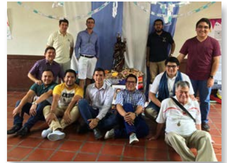
Colômbia: Noviciado La Valla em Medellín