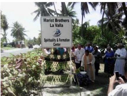
Kiribati: Lanzamiento del Año La Valla - Centro de Espiritualidad y Formación, Bikenibeu