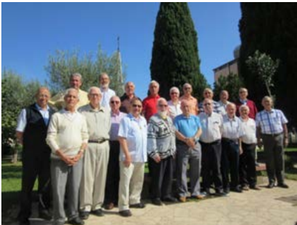
Casa general: Formación "Amanecer" para hermanos de la tercera edad