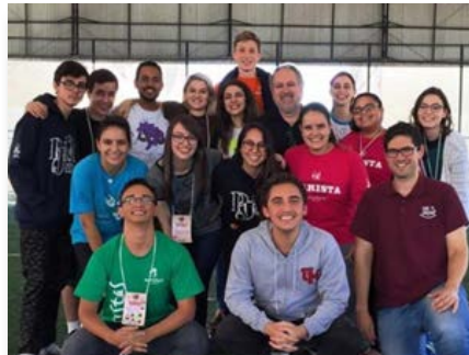
Brasil: Comisión de jóvenes de la Provincia Brasil Centro-Sul