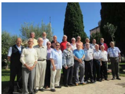
Maison générale: Frères participent au cours « Aurore »