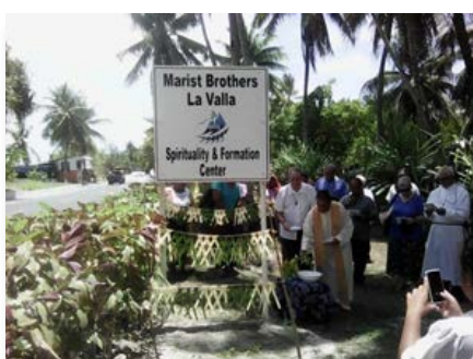
Kiribati: Ouverture de l'année La Valla à Bikenibeu