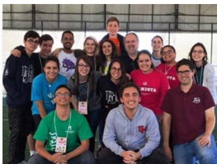
Brésil: Jeunes de la Province Brasil Centro-Sul