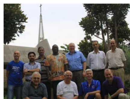
Maison Générale: Quatrième réunion de la Commission préparatoire du chapitre général